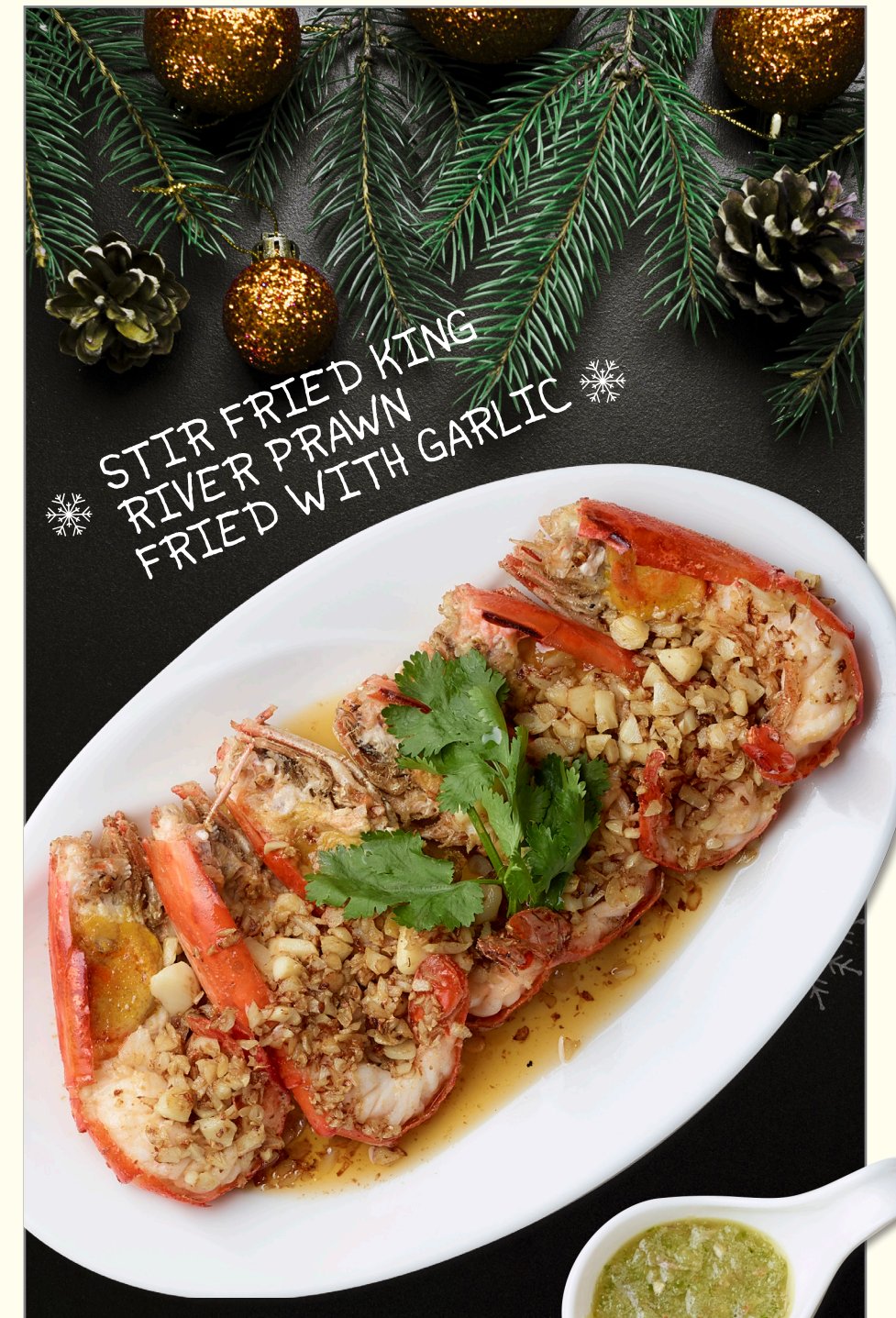
STIR FRIED KING RIVER PRAWN FRIED WITH GARLIC

รวมของดีสี่ภาคไว้สำหรับโอกาสพิเศษ ส่งท้ายปีอย่างสุขสันต์กลมกล่อมด้วยน้ำซุปลีดสดไทยกับกรอบครัว หรือให้รางวัลตัวเองเป็นอาหารจานเดียวสุดระดม อย่างข้าวอบหมูกรอบคั่วกระเทียมพริกเกลือ คัดเลือกข้าวพันธุ์ดีจากเชียงราย เสิร์ฟพร้อมหมูกรอบห่าชิ้นคั่วจนกรอบหอมกลิ่น * ข้าวอบหมูกรอบคั่วกระเทียมพริกเกลือ 250.- ★ POT MINISTRY ชั้น 8, Helix Sky Dining, The EmQuartier Ins. 0-2003-6282