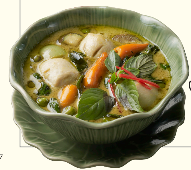
GREEN CURRY WITH PHUKET FISH BALLS

เติมเต็มเทศกาลแห่งความสุขด้วยร้านอาหารในดวงใจ ในบรรยากาศห้องข้าวสุดอบอุ่นใจกลางเมือง ดูทุกคนในบ้านในวันพิเศษด้วยก๊วงแม่น้ำหลังทอดเกลือ หมกหน้ากระเทียมเนื้อหวานดังสุดกรอบ หรือแกงเขียวหวานลูกชิ้นปลาทุกเนื้อหวานดัง เพียงราดข้าวสวรรค์ก็ถูกดังมาอยู่ตรงหน้า * แกงเขียวหวานลูกชิ้นปลาทุกเนื้อหวานดัง (Green Curry with Phuket Fish Balls) 350.- * ก๊วงแม่น้ำหลังทอดเกลือหน้าหมกกระเทียม (Stir Fried King River Prawn Fried with Garlic) 1,290.- ★ LUK KAITHONG ชั้น 6, Helix Sky Dining, The EmQuartier Ins. 0-2003-6301-2