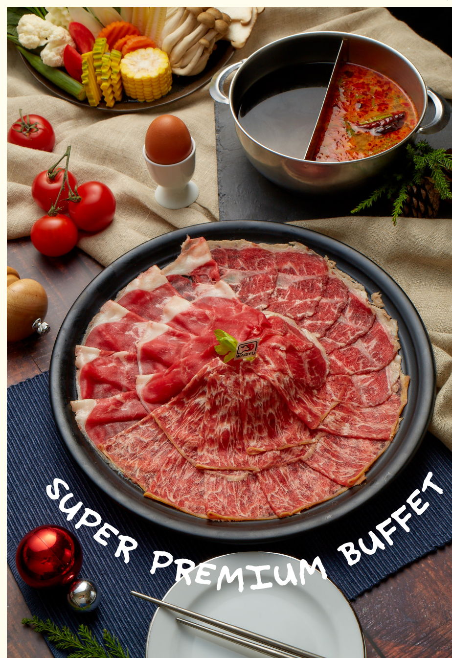
SUPER PREMIUM BUFFET