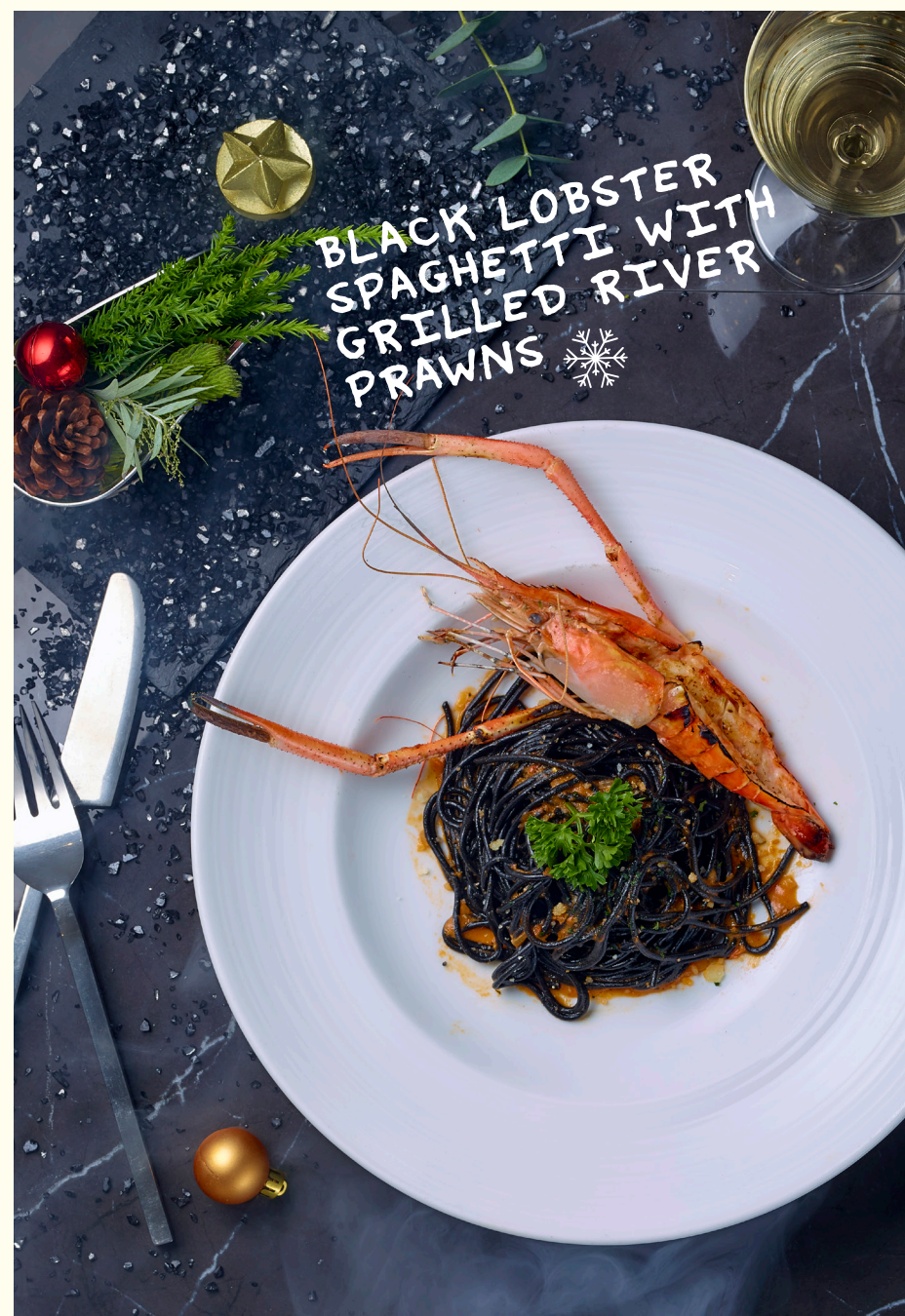
BLACK LOBSTER SPAGHETTI WITH GRILLED RIVER PRAWNS