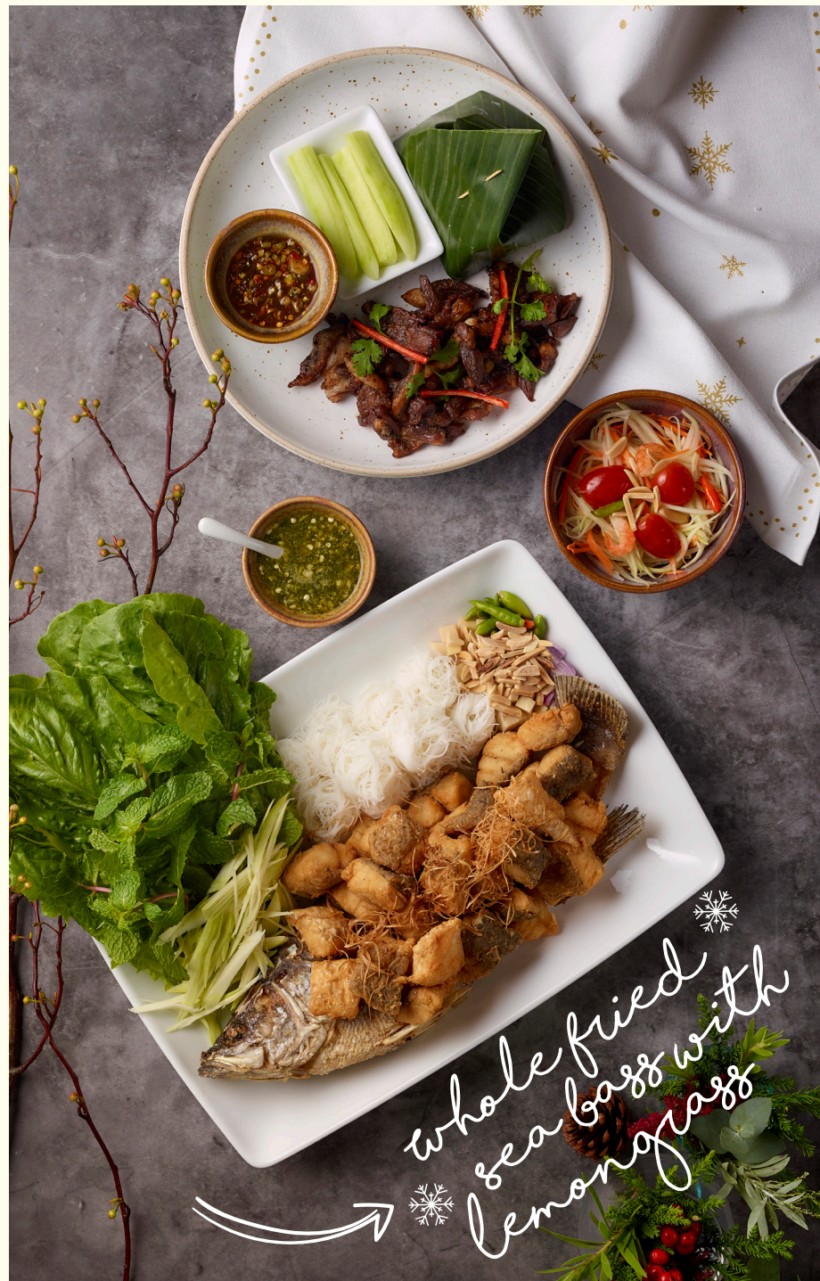
whole fried sea bass with lemongrass